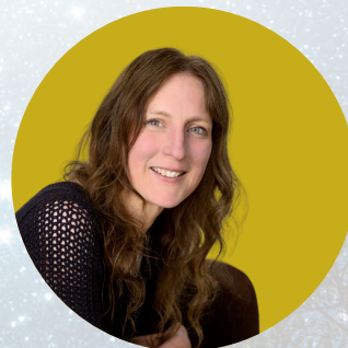
Ludivine Bantigny Historienne, spécialiste des engagements, des soulèvements populaires et des processus révolutionnaires*