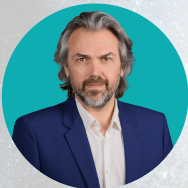
Aymeric Caron Président-fondateur de la REV, député de Paris