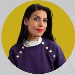
Fatima Ouassak Essayiste, autrice de Pour une écologie pirate