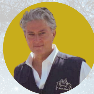
Christophe Marie Auteur de L'Europe des Animaux